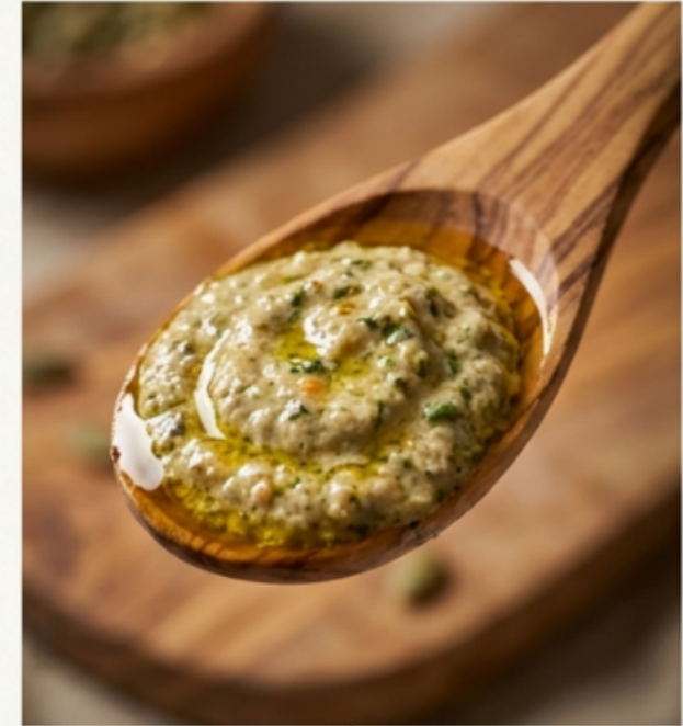
Après l'alchimie : Une rondeur inédite, une texture onctueuse, des arômes profonds.

Le temps remplace la chaleur. Sans aucune cuisson, les saveurs s'entremêlent et créent un équilibre parfait où l'ail devient doux et le végétal s'épanouit.