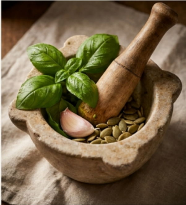
Avant l'attente : Vif, herbacé, cru.

Le temps remplace la chaleur. Sans aucune cuisson, les saveurs s'entremêlent et créent un équilibre parfait où l'ail devient doux et le végétal s'épanouit.